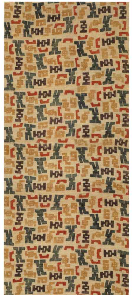
《型染幾何文布》柚木沙弥郎 1954年 358.0×92.0cm (部分) 日本民藝館蔵