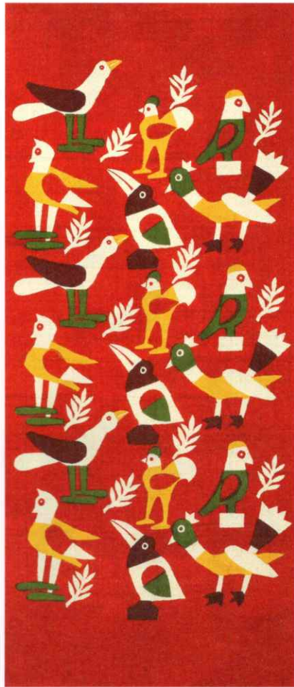
《喜びの鳥》柚木沙弥郎 1983年 176.0×76.0cm 日本民藝館蔵

〒542-8510 大阪市中央区難波5丁目1番5号 TEL 06-6631-1101