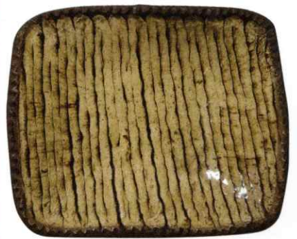
《黄釉流描角鉢》武内晴二郎 6.5×34.0×28.5cm 1953年 日本民藝館蔵