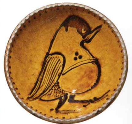
《黄釉鳥文鉢》 ふなきけんじ 船木研兒 11.5×40.0cm 1952年頃 日本民藝館蔵