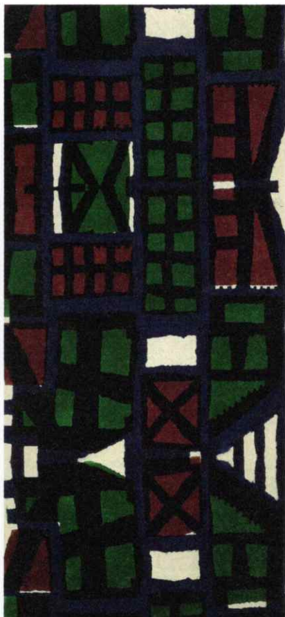
《注染幾何文布》柚木沙弥郎 1952年 613.0×85.0cm (部分) 日本民藝館蔵